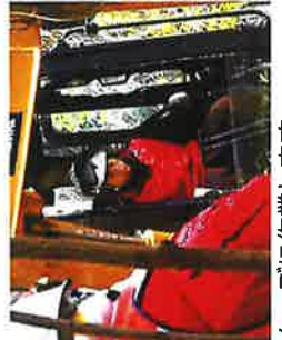
専用の機械を使いスムーズに作業します。

山仕事は、苗木を植え、下刈り、枝打ち、除間伐などをしながら豊かな森林を育て、育成した木を伐採して木材を生産・収穫する仕事です。自然を相手に地球温暖化防止や地域の環境、さらに人々の暮らしを支える有意義な仕事です。